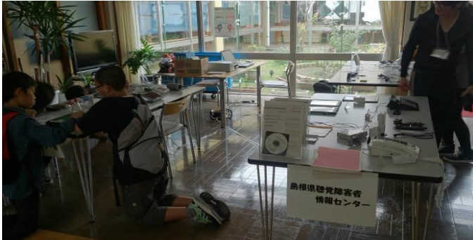
10月23日 ますだししょうがいしゃふくし 益田市障害者福祉センター「あゆみの里」

昨年 さくねん も、西部各地 せいぶかくち で視覚 しかく や聴覚 ちようかく に障がい しょう のある方 かた のための福祉機器 ふくしき 展示会 きてんじかい を開催 かいさい しました。 たくさんの方 らいじょう にご来場 らいじょう いただき、ありがとうございました。