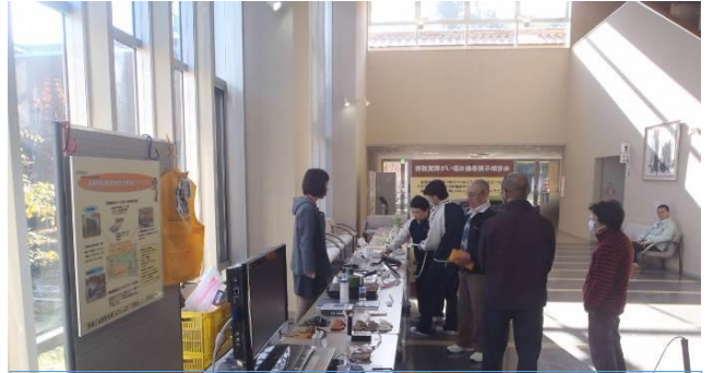
11月16日 おおなんちようけんこう 邑南町健康センター 元気館