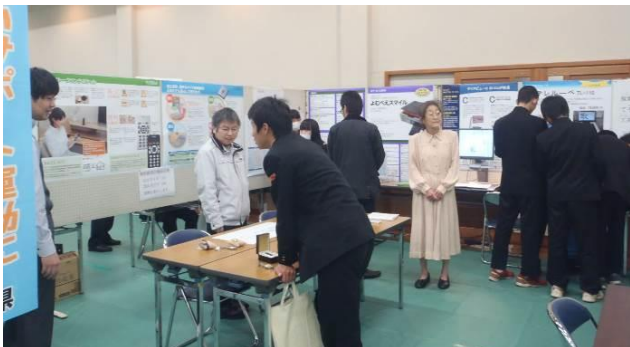
12月6日～7日 ますだしじんけん 益田市人権センター