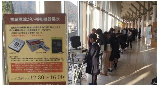
12月8日 かわもとまち ゆうゆう (川本町) 悠呂ふるさと会館