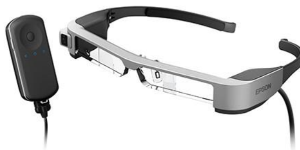
※スマートグラス EPSON MOVERIO BT-300