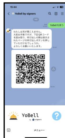
↑トーク画面のQRコード

※相手はLINEを登録する必要はありません。 ※登録の方法や、使いかたなどがわからない時は、センターまでお問い合わせください！