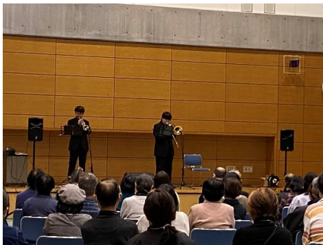
生演奏に耳を傾けている様子

また、休憩時間には便利グッズや避難用防災リュックなどの展示を熱心に眺めたり、久しぶりに会う人や職員と交流したり、楽しいひとときをすごしました。