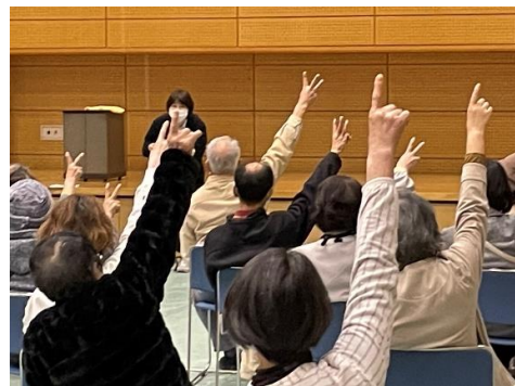
クイズ大会の様子